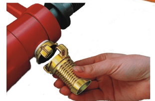
DK09: Saugtülle ankuppeln bereit zum Trockenbohren